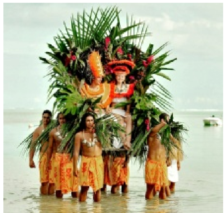
► La celebración tiene que ocurrir al atardecer y en la playa.

La pareja es conducida hasta el "marae" o lugar de rezo, donde les da la bienvenida el "Tahua", sacerdote. El ritual se rea-