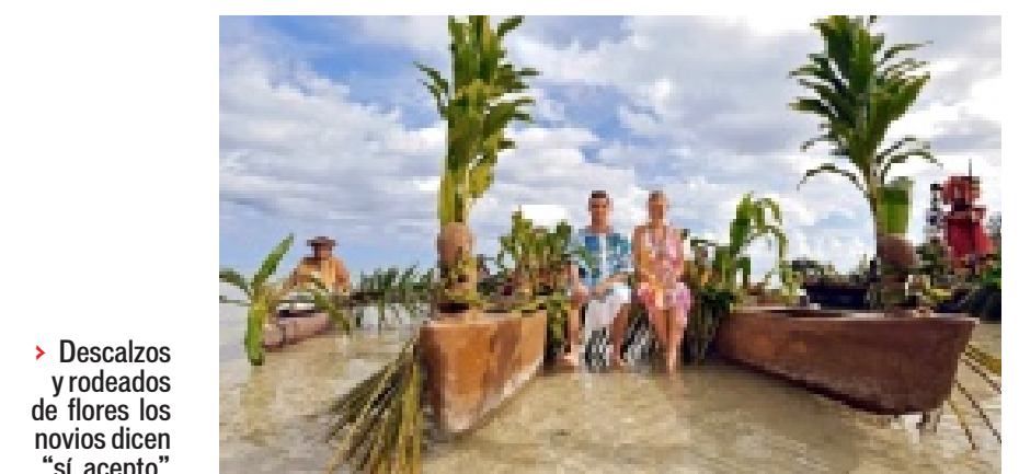
► Descalzos y rodeados de flores los novios dicen "sí, acepto".