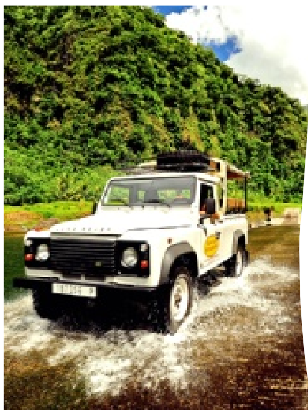
► Hay que dejarse llevar por el singular ritmo de vida de los isleños, siempre hedonistas y muy aventureros.

Volamos con Air Tahití en un avión de hélices rumbo a la llamada Perla del Pacífico. Nos obsesionamos por sentarnos del lado de la ventana, ya estábamos avisados: Bora Bora desde el aire es el paraíso en la Tierra.