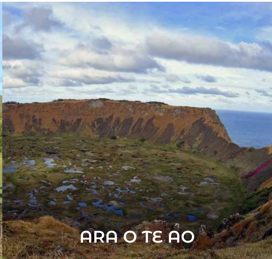
ARA O TE AO